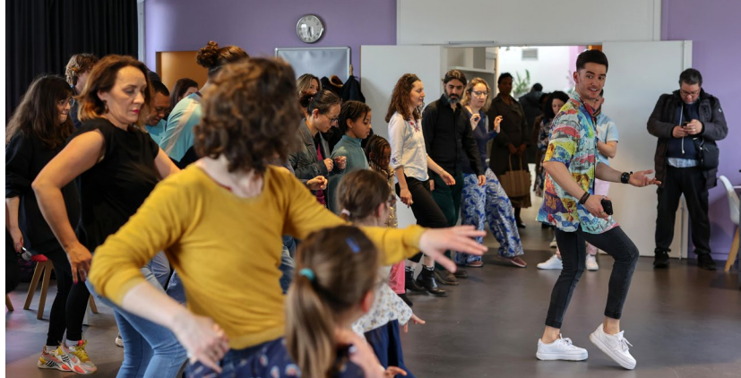
► MÉDIATHÈQUE On se sentait presque à La Havane le 27 avril ! En collaboration avec l'association Cuba 10, la médiathèque proposait une journée avec diverses animations en lien avec la culture cubaine.