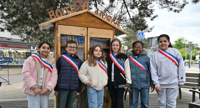
► CME Pour faire vivre la boîte à livres qu'ils ont imaginée et que les services techniques municipaux ont réalisée, les jeunes élus du Conseil Municipal des Enfants sont venus y déposer, le 24 avril, des livres qui leur ont été donnés par la médiathèque.