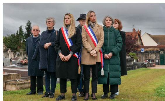
► COMMÉMORATION Le dernier dimanche d'avril marque la journée dédiée au souvenir des victimes de la déportation. Comme tous les ans, la Ville et les associations d'anciens combattants leur rendaient hommage.