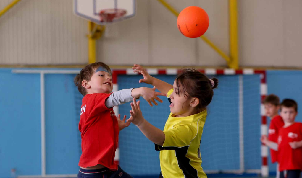
► HANDBALL Dimanche 3 avril au gymnase Ladoumègue, le club Portes de l'Essonne Handball accueillait 5 clubs essonniers pour une rencontre amicale des 5-7 ans.