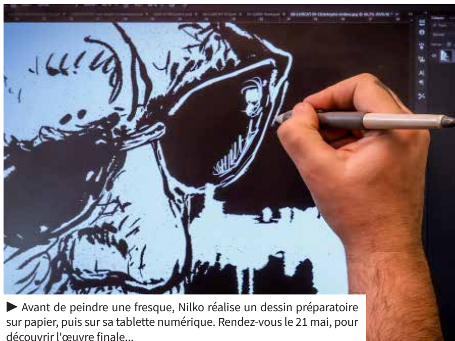
► Avant de peindre une fresque, Nilko réalise un dessin préparatoire sur papier, puis sur sa tablette numérique. Rendez-vous le 21 mai, pour découvrir l'œuvre finale...

Samedi 21 mai, rendez-vous devant l'espace Jean Lurçat à partir de 17h pour découvrir la fresque. + d'infos : 01 69 12 50 65