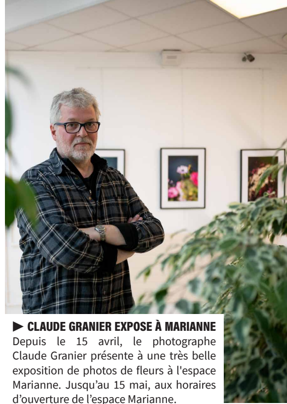
► CLAUDE GRANIER EXPOSE À MARIANNE Depuis le 15 avril, le photographe Claude Granier présente à une très belle exposition de photos de fleurs à l'espace Marianne. Jusqu'au 15 mai, aux horaires d'ouverture de l'espace Marianne.