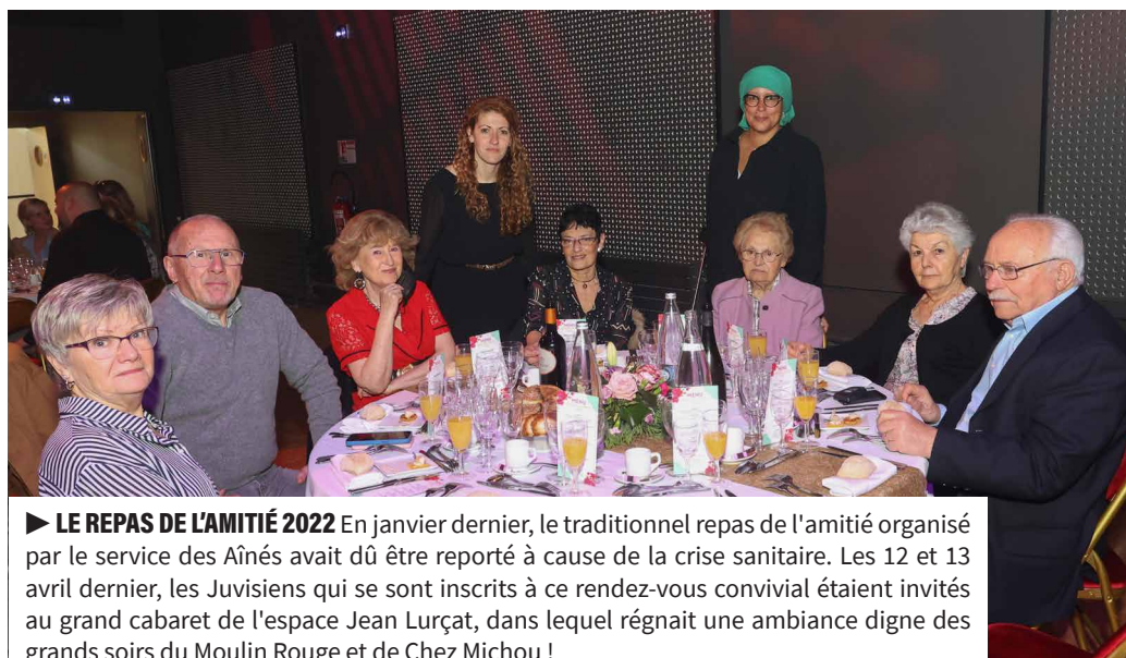
► LE REPAS DE L'AMITIÉ 2022 En janvier dernier, le traditionnel repas de l'amitié organisé par le service des Aînés avait dû être reporté à cause de la crise sanitaire. Les 12 et 13 avril dernier, les Juvisiens qui se sont inscrits à ce rendez-vous convivial étaient invités au grand cabaret de l'espace Jean Lurçat, dans lequel régnait une ambiance digne des grands soirs du Moulin Rouge et de Chez Michou !