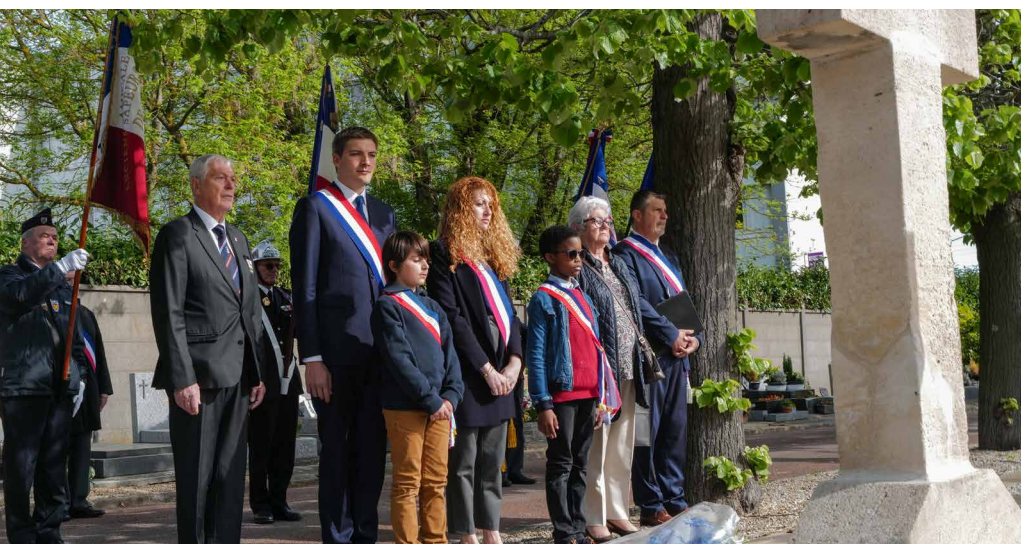
► MÉMOIRE Chaque année le 18 avril, Juvisy se souvient de cette nuit de 1944, quand le bombardement de la gare de triage de Juvisy détruisit une grande partie de la ville. Lundi 18 avril, Madame le Maire a souhaité mettre cette cérémonie en perspective de la guerre en Ukraine et des centaines de milliers de victimes des bombardements commis par l'armée russe depuis le 24 février dernier.