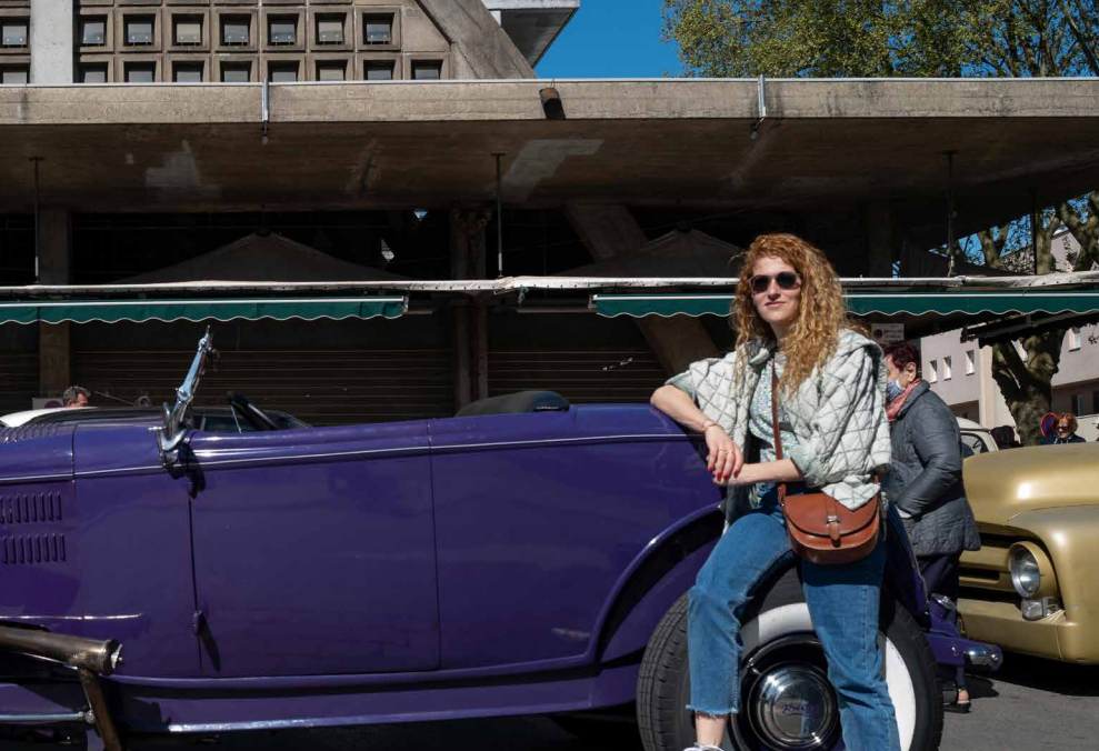
► DANS LA TIRE À CHRISTOPHE ! Dimanche 17 avril, la concentration de voitures anciennes organisée Place de l'Orge a connu un succès inespéré. Au programme : belles mécaniques, musique avec les musiciens du Harvest Blues Band et soleil ! Cette journée était organisée dans le cadre de l'hommage rendu par la Ville à Christophe.