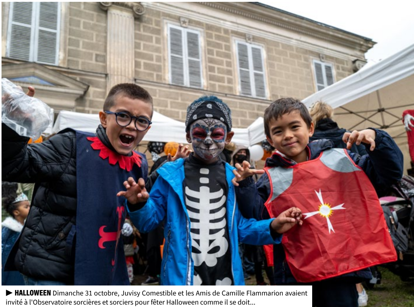
► HALLOWEEN Dimanche 31 octobre, Juvisy Comestible et les Amis de Camille Flammarion avaient invité à l'Observatoire sorcières et sorciers pour fêter Halloween comme il se doit...