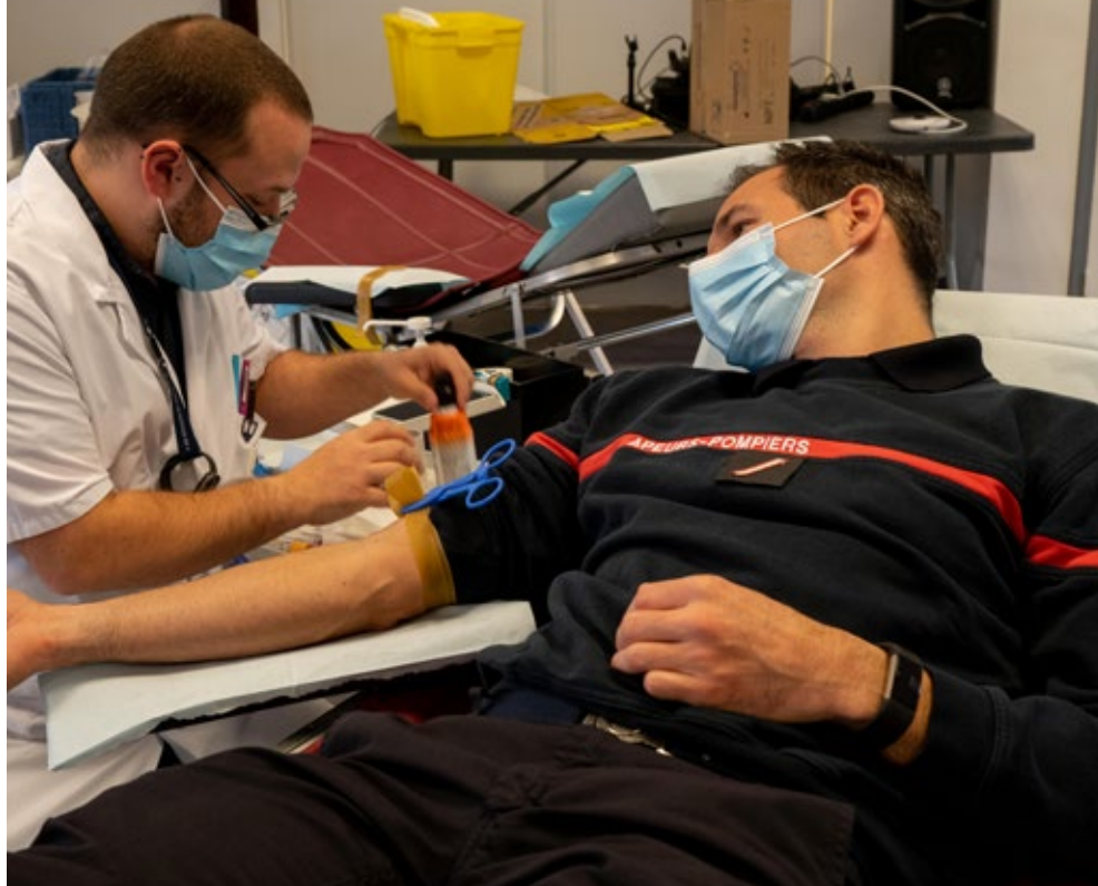
► DON DU SANG Mercredi 3 novembre, les pompiers de Juvisy se sont une nouvelle fois mobilisés pour donner leur sang à l'occasion de la collecte de l'Établissement Français du Sang. Merci à eux !