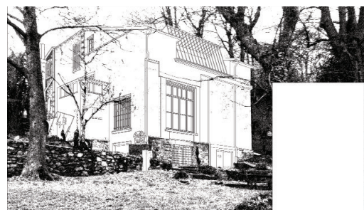
Christophe Cuzin, 2018