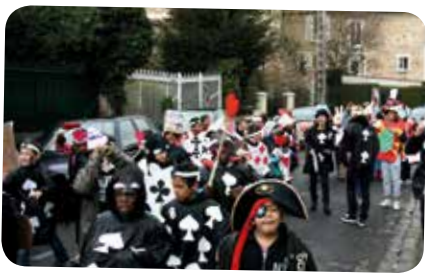
Carnaval du Centre de Loisirs le 26 mars 2014