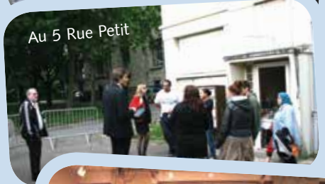
Au 5 Rue Petit

Malgré une météo n'annonçant pas les meilleurs auspices, le Fête de quartier Seine a rassemblé une nouvelle fois un public nombreux, le 24 mai 2014.