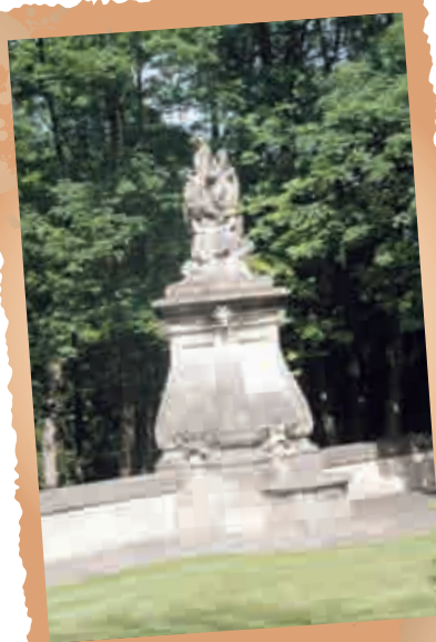
Fontaine créée par des artistes de l'Académie au XVIII ème siècle

L'illustre famille Rossignol des Roches a succédé à plusieurs nobles familles à la