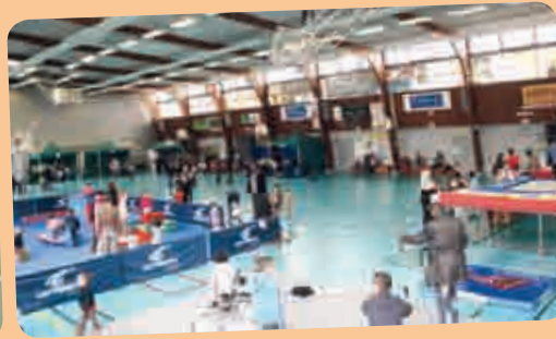
La journée Sport et jeux en famille du 25 mai au gymnase Ladoumègue