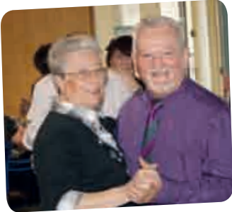
Thé dansant du 23 mai au centre administratif de la Mairie.