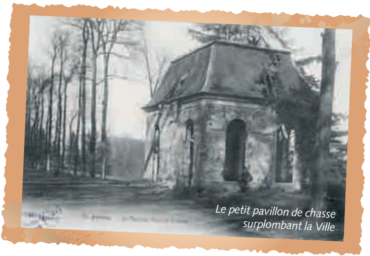
Le petit pavillon de chasse surplombant la Ville

Lexique : *Noblesse de robe : nobles qui occupaient des fonctions de gouvernement notamment dans la justice et les finances.