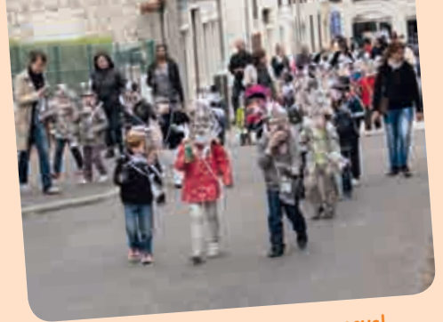
L'école Saint-Exupéry faisait son carnaval le 14 mai dernier.