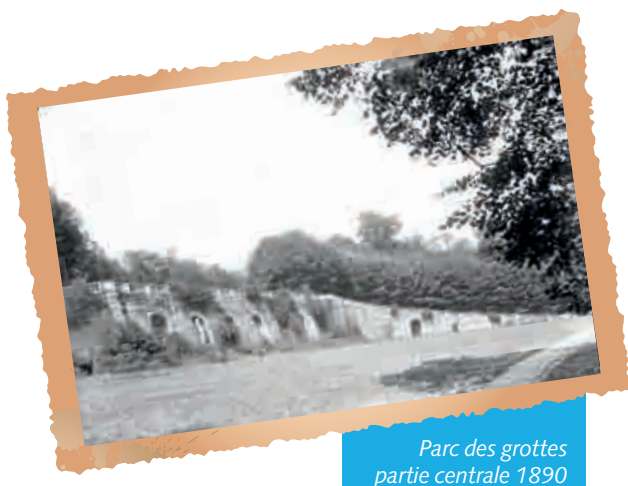
Parc des grottes partie centrale 1890

Cette nouvelle période marque un tournant dans le parc des grottes. Le fils du comte, très accaparé par ses fonctions diplomatiques, se désintéresse peu à peu de la propriété. A partir des années 1850, la question de la vente de la propriété se pose. La famille de Monttessuy acquière des terres et des châteaux en Normandie et en Touraine, entre 1862 et 1887.