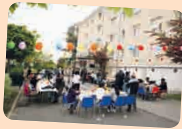
La Fête des voisins le vendredi 31 mai