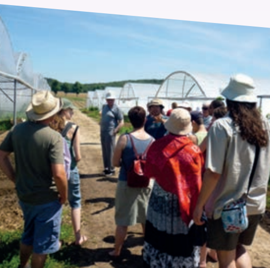
© AMAP en Seine Brin d'Orge