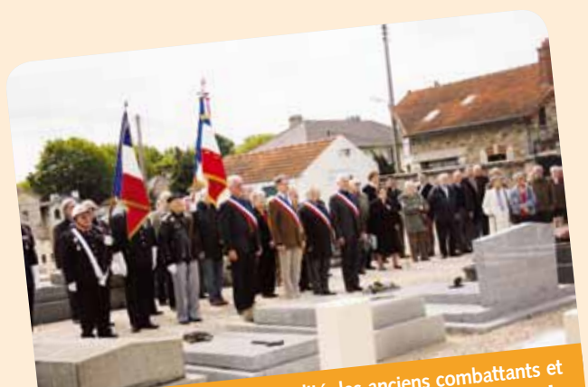
Le 8 mai dernier, la municipalité, les anciens combattants et les habitants ont commémoré l'armistice de la fin de la Seconde Guerre Mondiale.

Par des expositions et des conférences animées par d'anciens combattants juvisiens, les élèves des classes de CM2 des écoles Jaurès et Michelet ont pu découvrir le bombardement de Juvisy et la 2 de Guerre Mondiale.