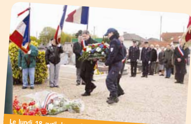
Le lundi 18 avril, la municipalité et les pompiers de Juvisy ont déposé des gerbes de fleurs au monument aux morts de l'ancien cimetière et à la caserne des pompiers, rue du Docteur Vinot en commémoration du bombardement de Juvisy.