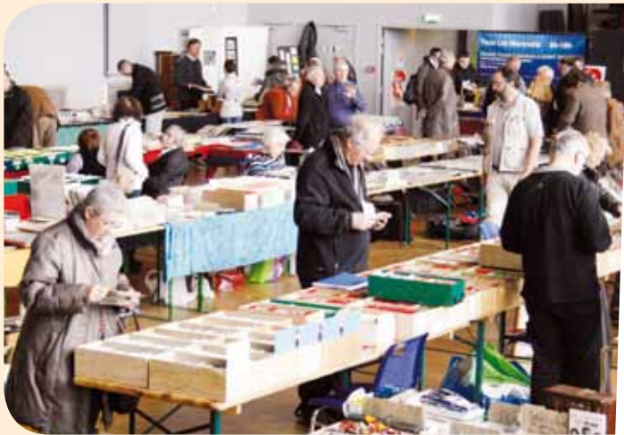
La 26 ème bourse aux cartes postales s'est tenue le dimanche 15 avril dernier à l'espace Jean-Lurçat pour le plus grand plaisir des collectionneurs comme des amateurs.

Les 17 et 18 mars derniers, la Tour de Juvisy, club d'échecs de l'ACJ jouait en Nationale 1 féminine à Versailles. Avec trois victoires sur trois, l'équipe termine à la première place et jouera la saison prochaine en TOP 12 féminine, l'élite nationale.