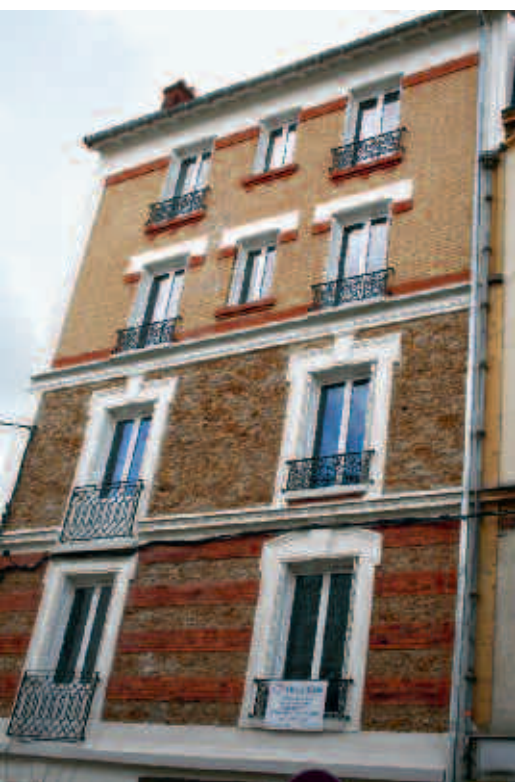
Le n°19 de la rue de Draveil a profité de l'OPAH et de l'AIS91.