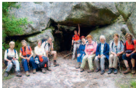
Les randonneurs de Castors et Castorettes ont profité d'une pause pour prendre la pose

Bien qu'assez acrobatique, la Capoeira est ouverte à tous car chacun peut évoluer à son niveau. Cet art martial camouflé en danse, qui se pratique en musique, est à lui seul une philosophie de vie. Ce sport complet, autant pour le corps que pour l'esprit, fait du