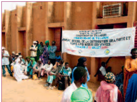
ACTU // PAGE 10