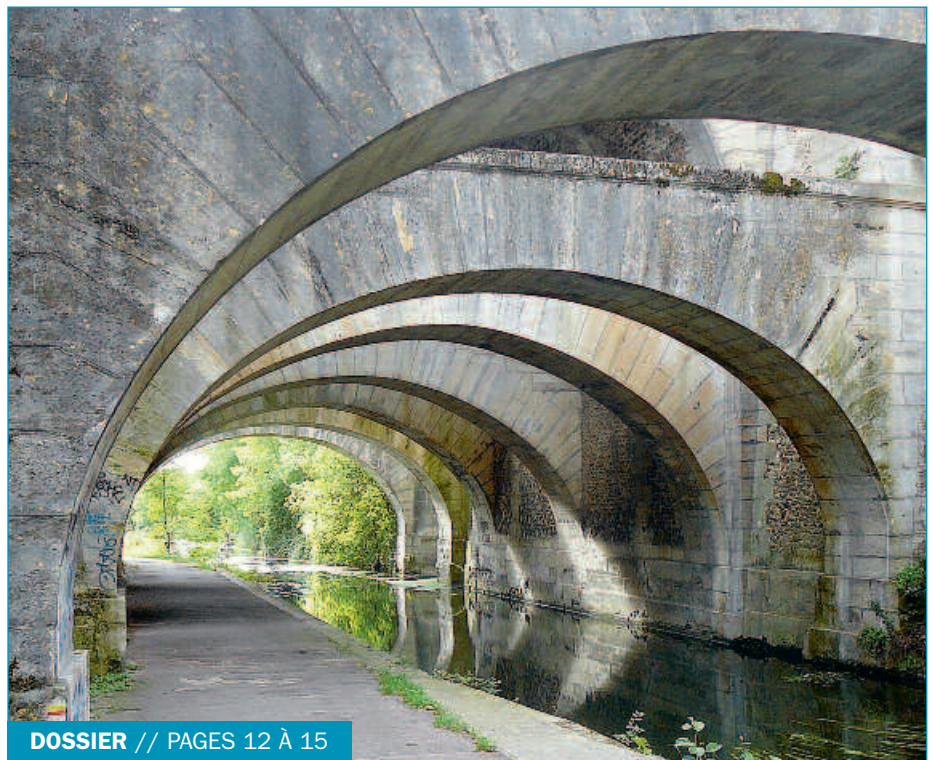
DOSSIER // PAGES 12 À 15