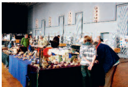
L'édition 2009 de l'expo-bourse d'échange de fossiles a été un succès