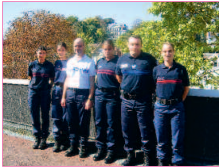
ACTU // PAGE 8