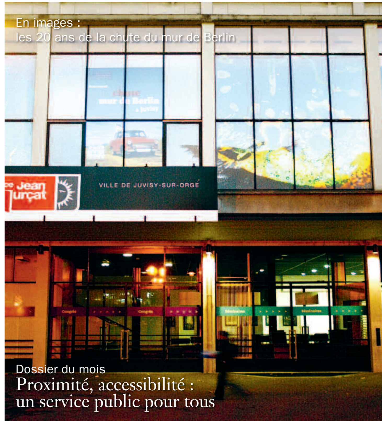
En images : les 20 ans de la chute du mur de Berlin

MAGAZINE D'INFORMATIONS MUNICIPALES DE JUVISY-SUR-ORGE