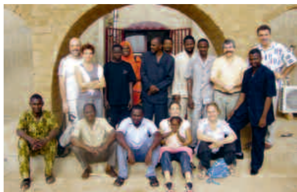
Coût total du chantier de la Maison de l'Amitié à Tillabéri : 125 751 €

Le chantier de la Maison de l'Amitié a débuté à Tillabéri en juin 2008. Equipée de lits, de douches, de sanitaires, cuisine, patios et d'une grande salle de réunion, la Maison de l'Amitié et ses 375 m 2 pourront accueillir dans de bonnes conditions des groupes de Juvisiens, des habitants de la Communauté d'Agglomération Les Portes de l'Essonne, des délégations officielles ou des visiteurs de passage. Située dans le quartier administratif, à proximité de la mairie, de la préfecture et du governorat, elle hébergera aussi les bureaux de l'ONG Rail, opérateur de la commune de Juvisy sur place, en charge de mettre