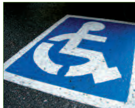
TRAVAUX // PAGE 8