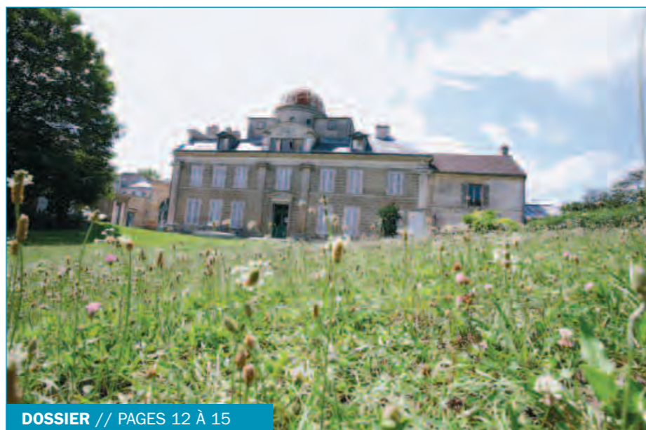
DOSSIER // PAGES 12 À 15