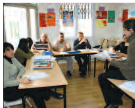
SOLIDAIRES // PAGE 10