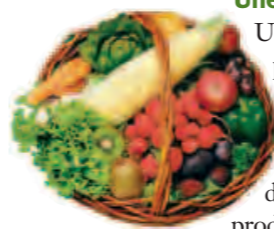
L'AMAP a pour objectif de rapprocher les consommateurs et les producteurs

Une AMAP est une Association pour le Maintien d'une Agriculture Paysanne. Des citoyens se regroupent pour acheter régulièrement auprès d'un agriculteur de la région des produits bio, en général des légumes. Consommateurs et producteurs partagent les risques et les bénéfices naturels liés à l'activité agricole. C'est pourquoi chaque consommateur achète à l'avance sa part de récolte par souscription. Les légumes, choisis conjointement par le producteur et les consommateurs avant la saison de production, sont partagés chaque semaine.