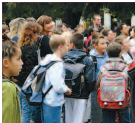
ACTU // PAGE 6