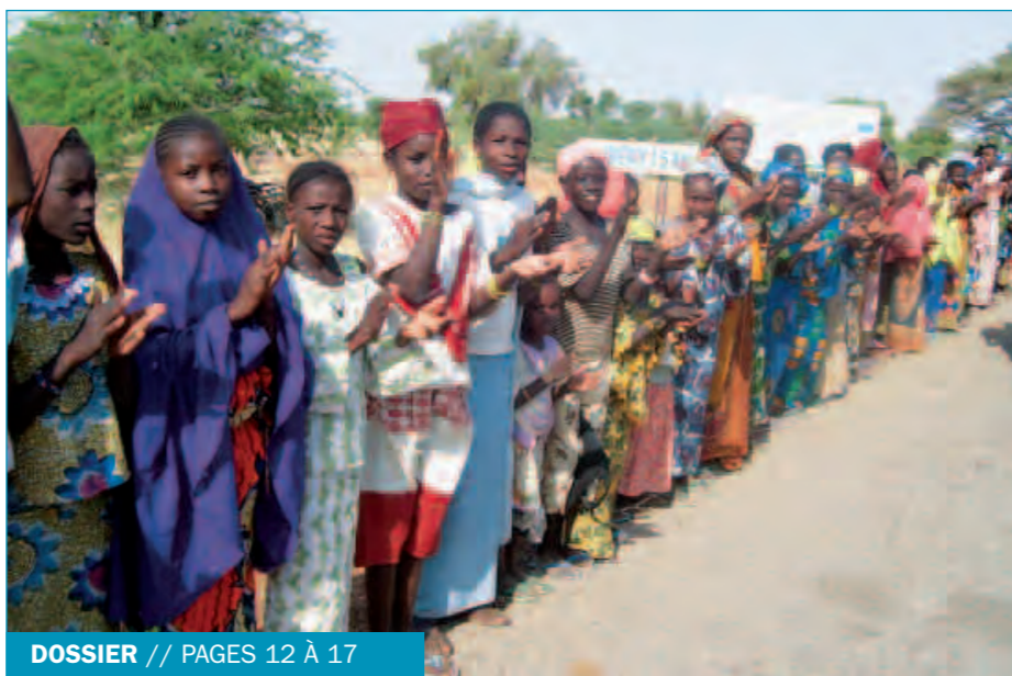
DOSSIER // PAGES 12 À 17