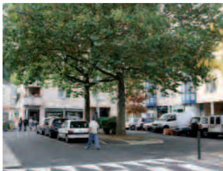
Le parking devant La Poste est terminé, quelques finitions restent à installer, comme des éléments en granit.

Ce mois-ci, pas de gêne particulière à prévoir concernant le chantier de rénovation de la rue piétonne, si ce n'est la poussière (et le stationnement des riverains*). Le parking devant La Poste est terminé, quelques finitions restent à installer, comme des éléments en granit. De son côté, l'éclairage est en grande partie posé. Sur la Grande rue, la pose des luminaires en façade côté des numéros pairs est en cours, et les anciennes enseignes abandonnées ou dont les commerçants ne veulent plus sont en train d'être déposées. Durant les vacances de la Toussaint, les bordures de la rue Piver ont été reprises, ainsi que le revêtement de chaussée et les affaissements rue du maréchal Juin, en amont de l'allée Jean Moulin.