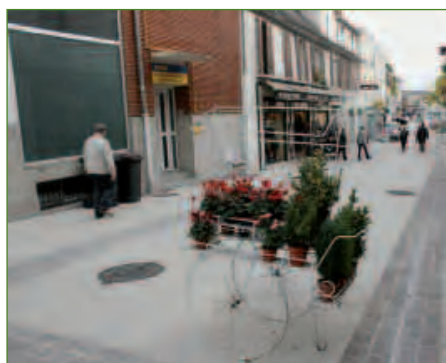
TRAVAUX // PAGE 8