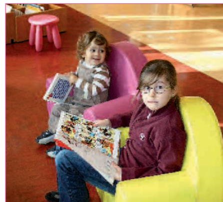
ACTU // PAGE 7