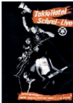
Le groupe Tokio Hotel a fait ses débuts à Magdeburg, ville d'origine du batteur, à une cinquantaine de kilomètres de Thale.

Concerts complets, cris d'admiratrices à outrance, regain de la langue allemande dans les écoles... c'est l'effet Tokio Hotel. Avec eux, une vague rock allemande a gagné l'Europe, annonçant le débarquement imminent au sommet des charts d'autres phénomènes tels que les groupes Killer Pilze, LaFee, Navada Tan, ou encore Nena, une chanteuse bien connue du jeune public français. Le phénomène fait mentir tous ceux pour qui la musique allemande se résumait à la grande musique