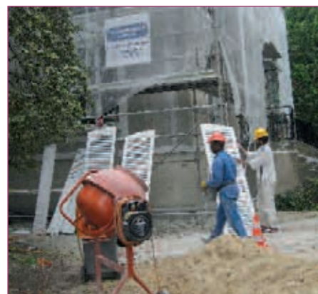
TRAVAUX // PAGE 9