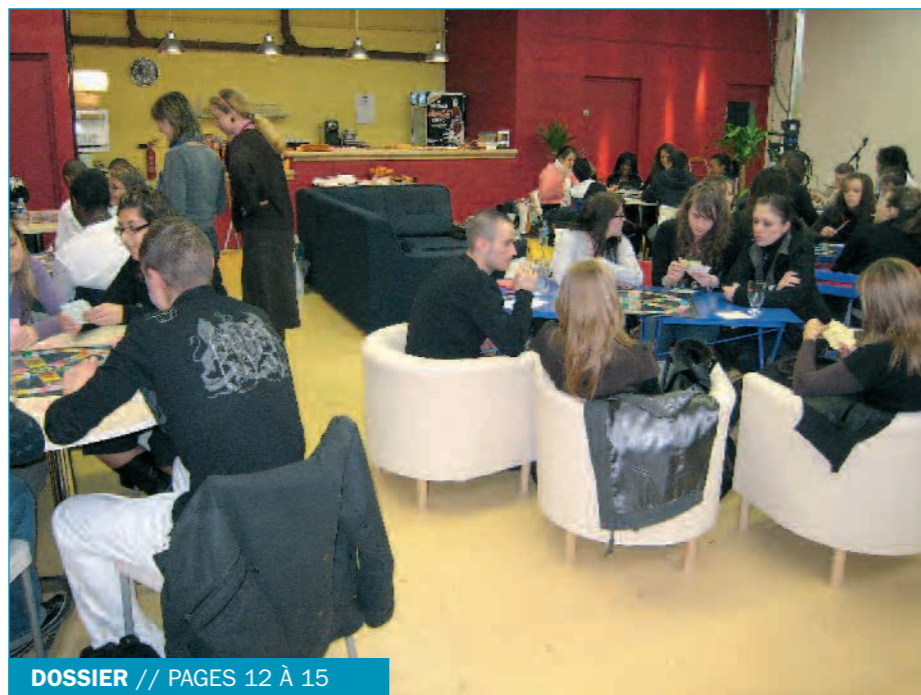
DOSSIER // PAGES 12 À 15