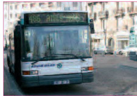
ACTU // PAGE 6