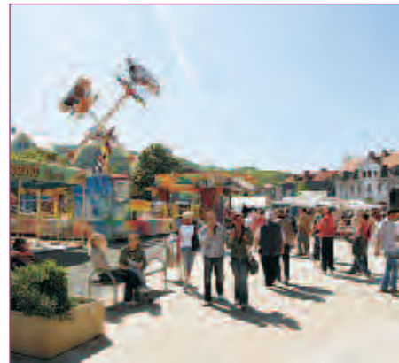
D'ICI ET D'AILLEURS // PAGE 10