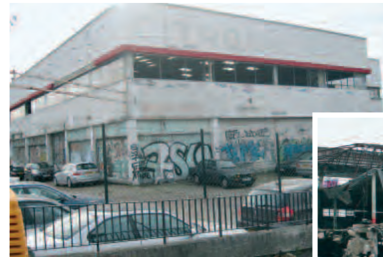
La friche de l'ancien garage Citroën, source de nuisances, défigurait l'entrée de Juvisy sur la Nationale 7.

Depuis la Nationale 7, on ne voit plus l'établissement délabré de l'ancien garage Citroën. Après l'impressionnante destruction du bâtiment, c'est maintenant derrière des palissades que se cache le chantier qui prépare le terrain pour la construction de nouveaux logements... Zoom en images.