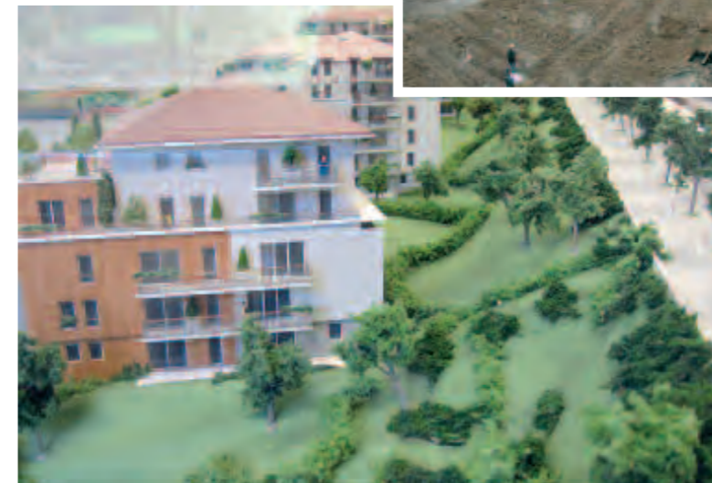
83 logements répartis sur 3 bâtiments sont prévus. 111 places de stationnement dont 96 en souterrain seront réalisées pour libérer des espaces verts aménagés par un paysagiste.