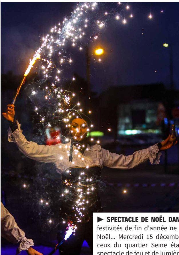
► SPECTACLE DE NOËL DANS LES QUARTIERS À Juvisy, les festivités de fin d'année ne se résument pas au marché de Noël... Mercredi 15 décembre, les habitants du Plateau et ceux du quartier Seine étaient conviés à un merveilleux spectacle de feu et de lumière...