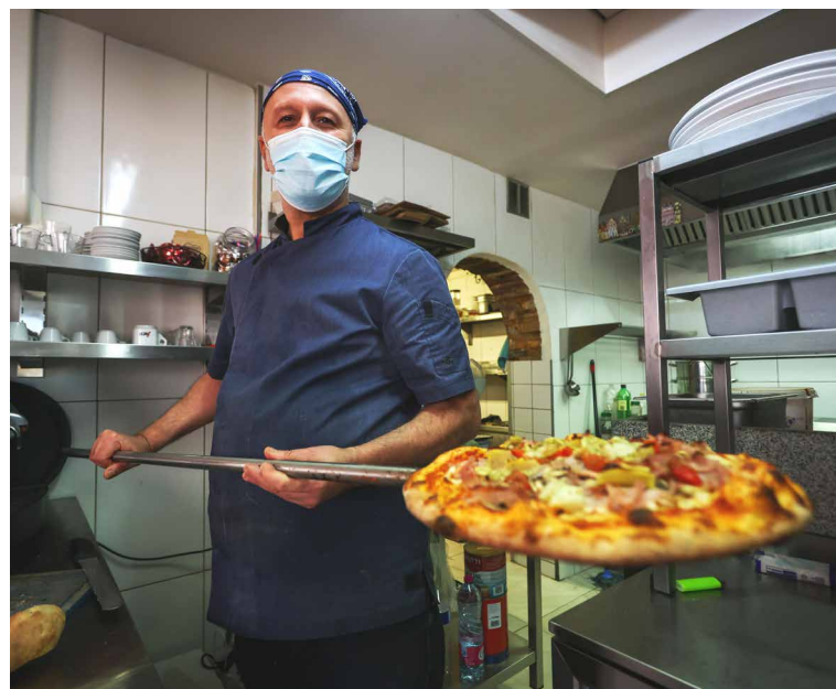
► PIZZA MARIO OBTIENT 2 PAPILLES D'OR ! Un immense bravo à Pizza Mario qui obtient deux Papilles d'or 2022, dans la catégorie Cuisine du Monde ! Pizza Mario, c'est une perle rare située au cœur du quartier du Plateau. Un restaurant à découvrir si ce n'est déjà fait, où l'on peut déguster d'excellente spécialités italiennes maison en contemplant les œuvres de Gustav Klimt !