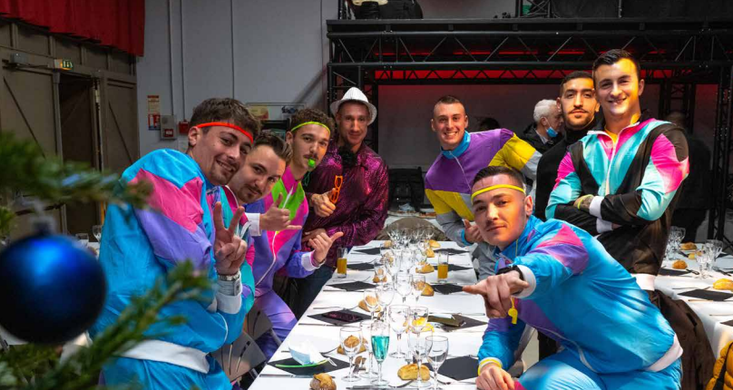
► SAINTE BARBE 2021 Samedi 4 décembre, nos amis les pompiers ont fêté la Sainte Barbe, la patronne de tous ceux qui sont amenés à « manier » le feu, les artilleurs, les sapeurs, les canonniers marins et bien entendu les sapeur-pompiers.