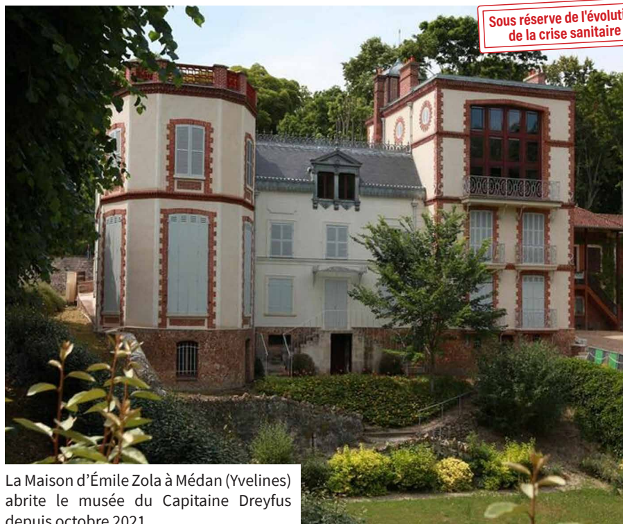
La Maison d'Émile Zola à Medan (Yvelines) abrite le musée du Capitaine Dreyfus depuis octobre 2021.

Le pass sanitaire et le port du masque seront exigés pour toutes les visites. Attention à la validité de votre pass sanitaire. Celui-ci devra impérativement intégrer la 3 ème dose si vous êtes éligible. Les visites pourront toutefois être annulées en fonction de l'évolution de la crise sanitaire.