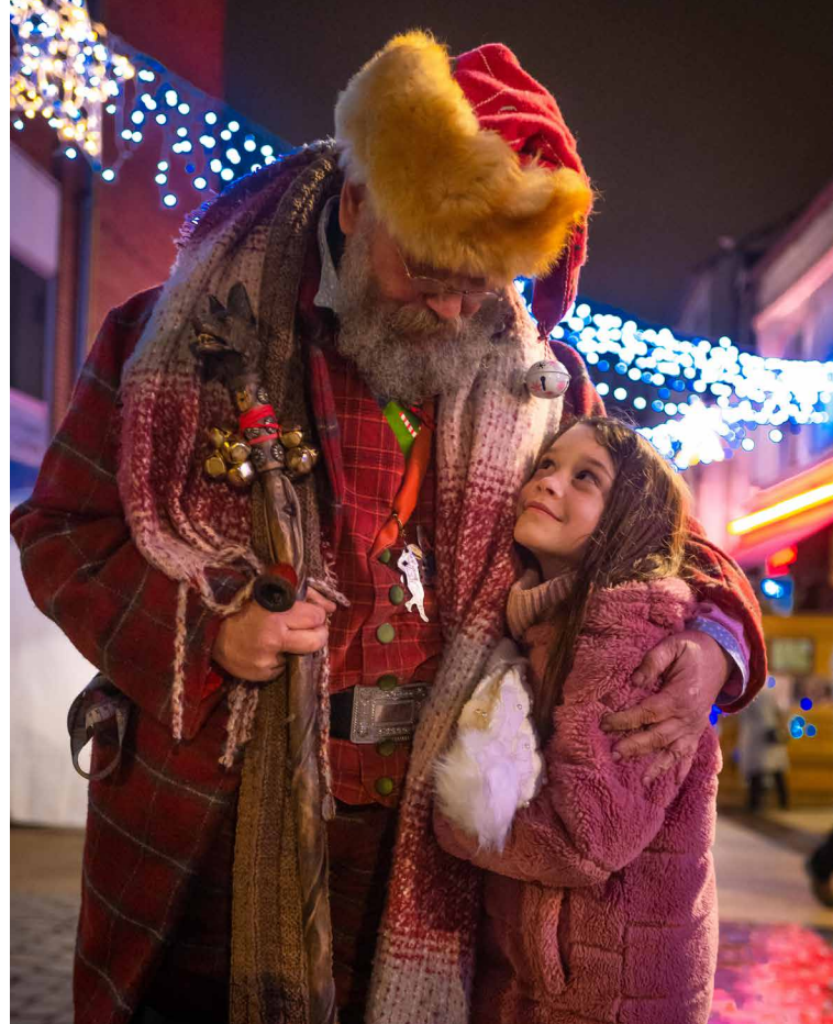
► MARCHÉ DE NOËL Les 10, 11 et 12 décembre, il flottait dans Juvisy comme un parfum de vin chaud et d'épices... Très attendu des habitants et des visiteurs, le public était au rendez-vous de notre marché de Noël.