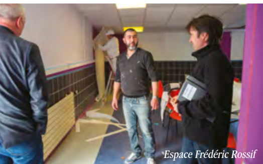
Espace Frédéric Rossif