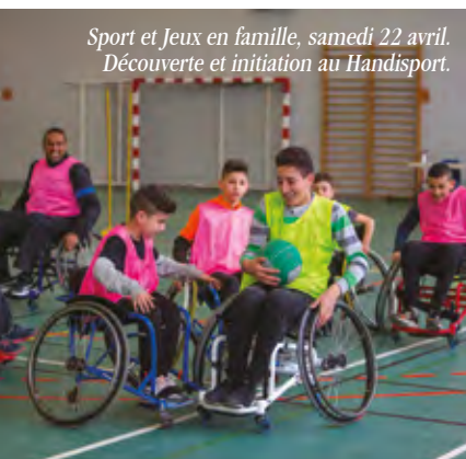
Sport et Jeux en famille, samedi 22 avril. Découverte et initiation au Handisport.