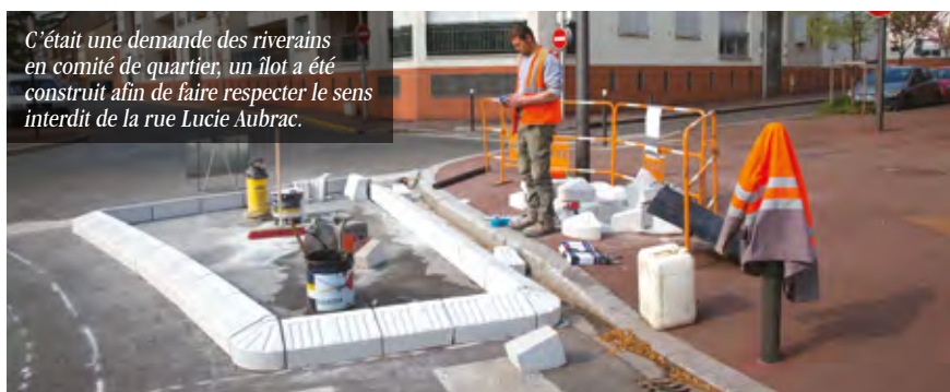
C'était une demande des riverains en comité de quartier, un îlot a été construit afin de faire respecter le sens interdit de la rue Lucie Aubrac.