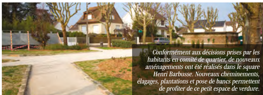
Conformément aux décisions prises par les habitants en comité de quartier, de nouveaux aménagements ont été réalisés dans le square Henri Barbusse. Nouveaux cheminements, élagages, plantations et pose de bancs permettent de profiter de ce petit espace de verdure.