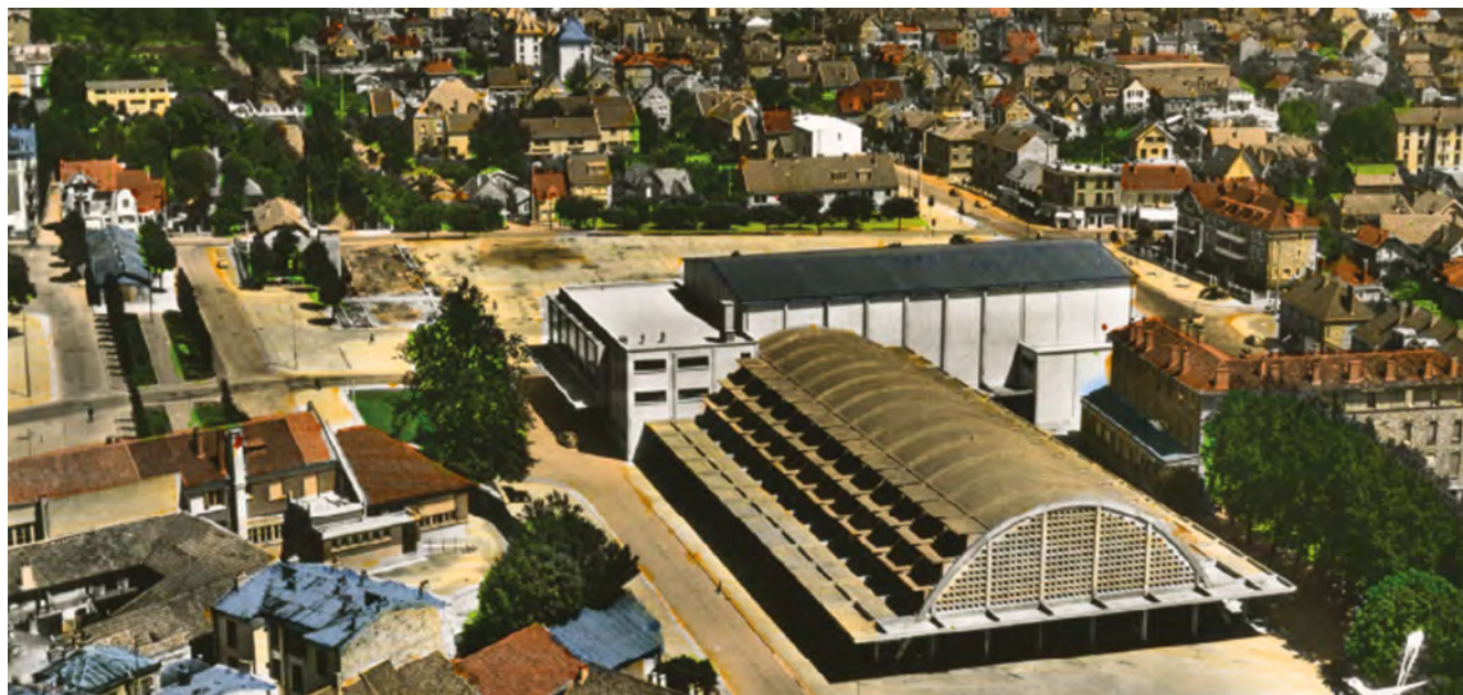
Vue aérienne des années 60. Fonds de la Maison de banlieue