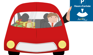
Illustration : Antonin Coppon

Pour faciliter vos courses de fin d'année, la Ville généralise le stationnement en zone bleue, du 15 novembre au 31 décembre . Une raison supplémentaire de venir faire vos emplettes dans les commerces de Juvisy ! Infos : 06 17 32 65 45