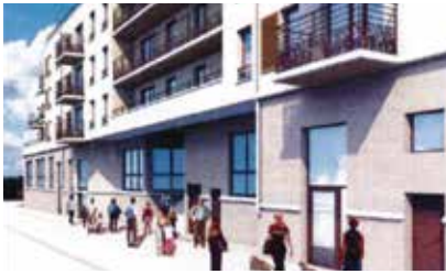
l'avenue de la République – entrée de l'école

Le projet accordé par la précédente majorité prévoyait la démolition de l'école existante vétuste et inadaptée pour la construction d'une nouvelle école en rez de chaussée et d'un programme immobilier d'accompagnement.