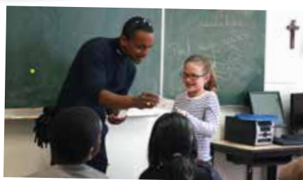
Remise des permis piétons par un agent de la Police Municipale aux enfants de l'école Sainte-Anne , le mardi 1 er juillet.

Toujours autant de succès pour le Thé dansant de l'ACJ , organisé par Willy. Ici le 26 juin à l'Espace Tocqueville .