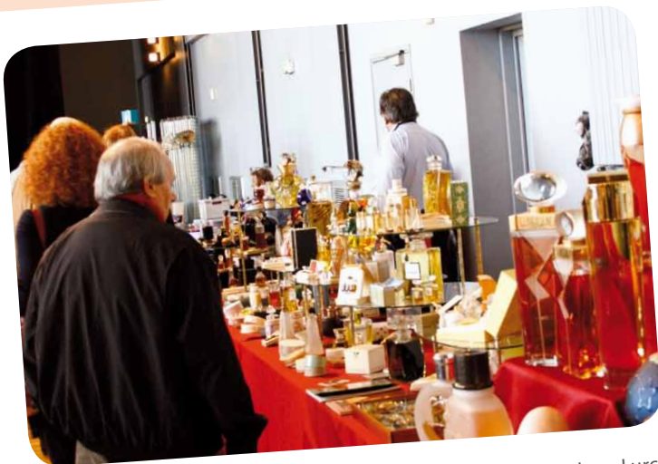
Les samedi 12 et dimanche 13 novembre derniers, l'espace Jean-Lurçat accueillait le Salon du Parfum organisé par l'association Les Enfants du Parfum, avec pour thème « Les 30 glorieuses ». Au programme de ce week-end festif, conférences, estimation gratuite de vieux flacons et de nombreuses découvertes olfactives !