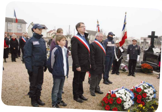
Pour le 93 e anniversaire de l'armistice de 1918, les Juvisiens, petits et grands, et leurs élus, se sont rendus au monument aux morts de l'ancien cimetière, puis au square du 11 novembre. Tous ont ensuite été invités au verre de l'amitié offert par la Ville.