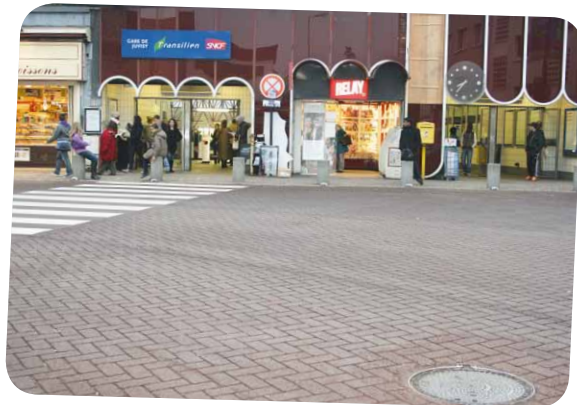
Depuis le début du mois de novembre, les usagers peuvent profiter d'un nouveau parvis devant la gare de Juvisy, sortie côté Mairie. Refait à neuf, il permet une meilleure circulation des bus et des voitures tout en assurant la sécurité des piétons.