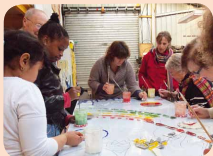
Durant les vacances de la Toussaint, du 24 octobre au 2 novembre, encadrés par un artiste plasticien, 5 jeunes et 5 retraités, tous juvisiens, ont travaillé ensemble à la création d'une œuvre artistique.