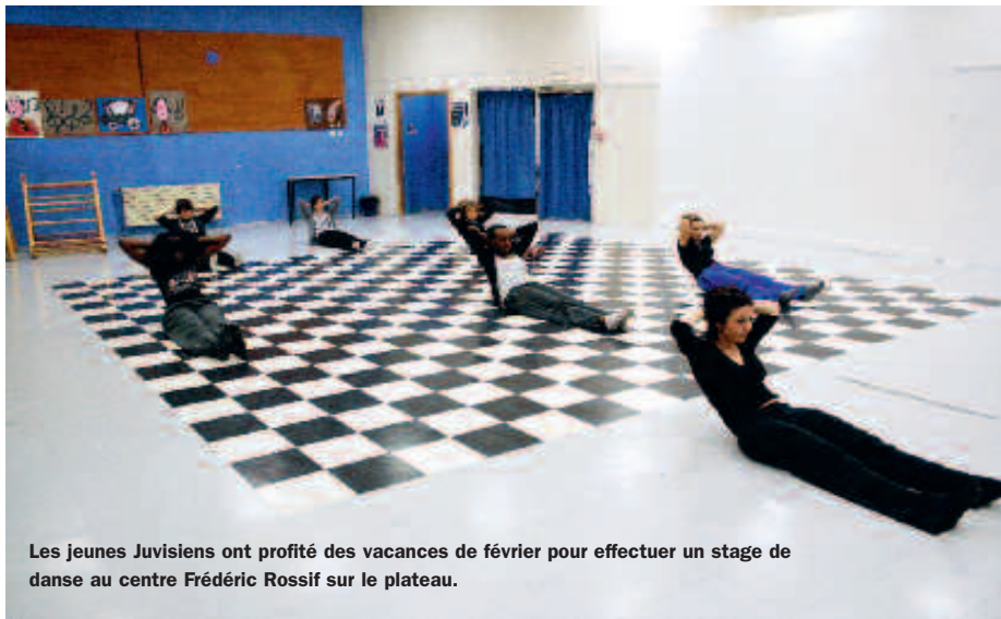
Les jeunes Juvisiens ont profité des vacances de février pour effectuer un stage de danse au centre Frédéric Rossif sur le plateau.