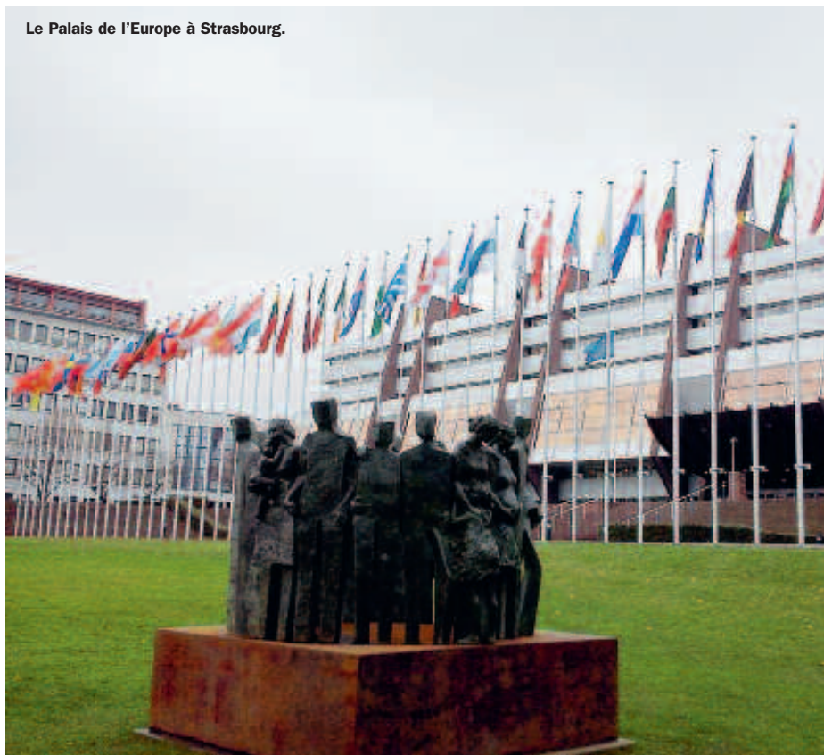
Le Palais de l'Europe à Strasbourg.

Cette année, les élèves des sections européennes Allemand du Lycée Marcel Pagnol participent à un concours proposé par l'Office Franco-Allemand de la Jeunesse (OFAJ), "Les jeunes écrivent l'Europe". Du 24 au 28 janvier, un groupe d'élèves s'est rendu à Fribourg et Strasbourg pour rencontrer des lycéens allemands et écrire avec eux sur des sujets européens. Ils ont choisi de travailler sur le thème de l'intégration. Zoom sur l'un des articles produits.