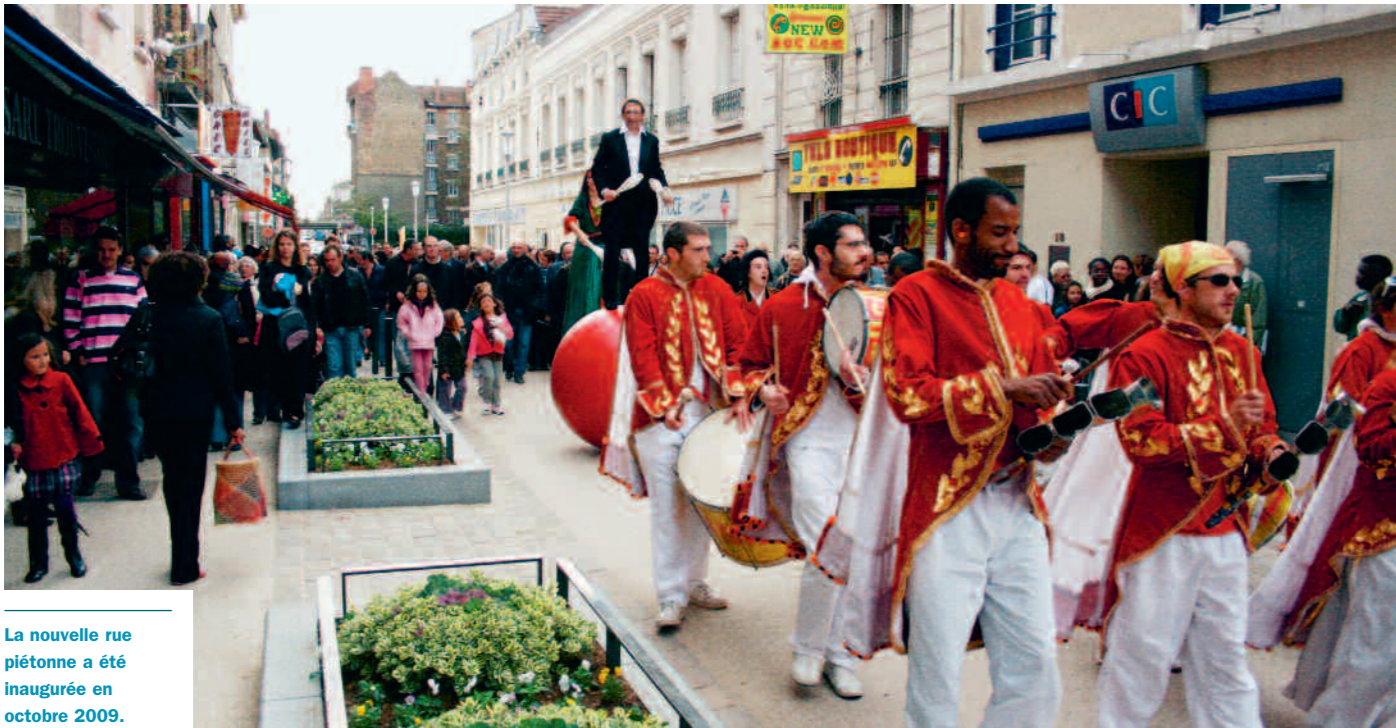
La nouvelle rue piétonne a été inaugurée en octobre 2009.

Dans le contexte actuel de crise du pouvoir d'achat et de l'émergence d'autres modes de consommation, des efforts partagés et concertés entre les différents acteurs du commerce doivent être faits pour préserver l'attractivité de notre cœur de ville.