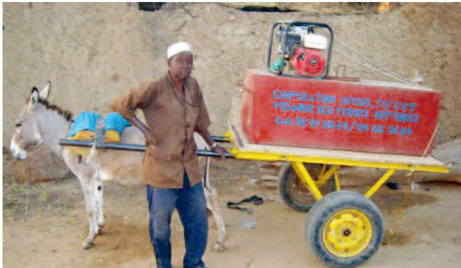
Un programme quadriennal a permis d'équiper le centre urbain de Tillabéri de latrines et de puits.

Le jumelage avec la Ville de Tillabéri fonctionne sur le principe de la coopération décentralisée. Les actions prévues et leurs modalités de fonctionnement sont définies par des conventions. Le jumelage avec Tillabéri prend des formes diverses. Voici le bilan de ce qui a été mené par la Ville au cours de l'année 2010.