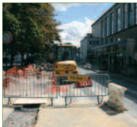
TRAVAUX // PAGE 9