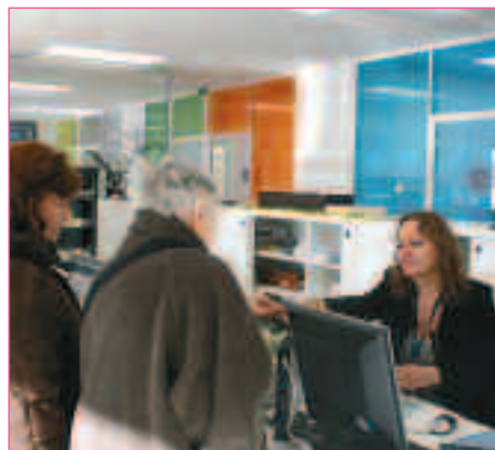
ACTU // PAGE 6