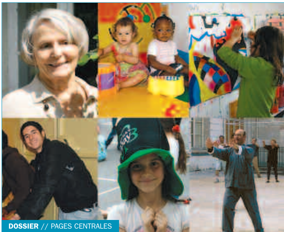
DOSSIER // PAGES CENTRALES