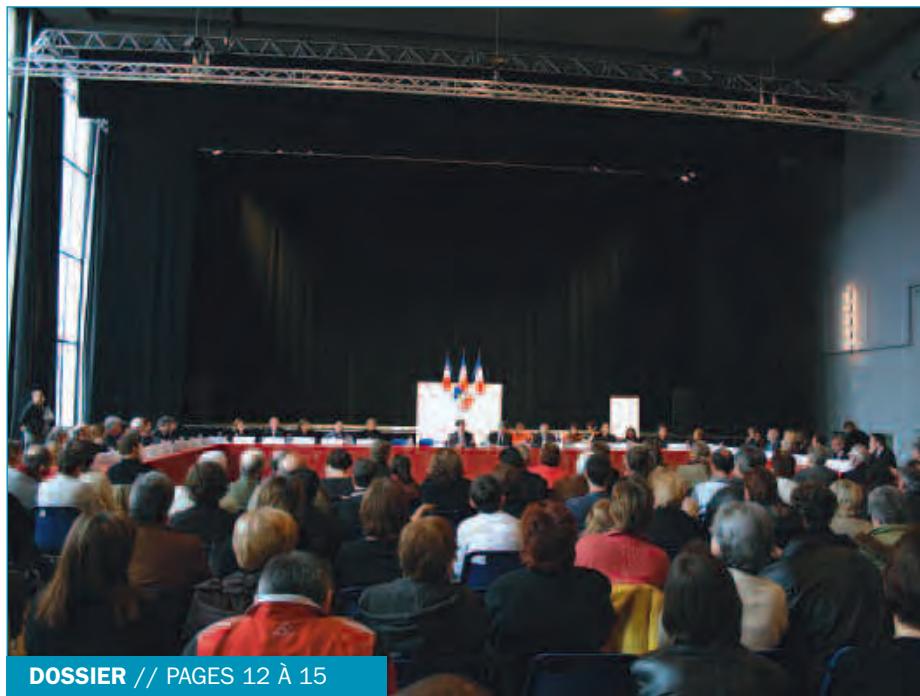
DOSSIER // PAGES 12 À 15