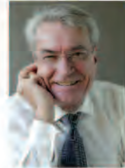
Christian GARDEN, quelles sont les grandes nouveautés