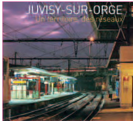
ACTU // PAGE 6