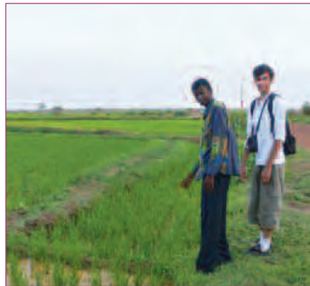
SOLIDAIRES // PAGE 10